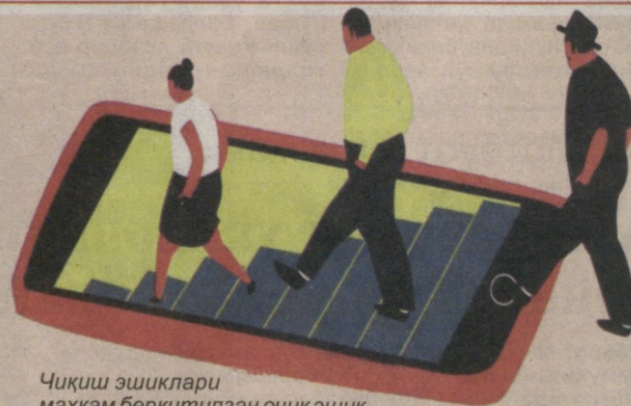
Чиқиш эшиклари маҳкам беркитилган очиқ эшик..

«МИЛЛИЙ ТИКЛАНИШ» ДЕМОКРАТИК ПАРТИЯСИНING ИЖТИМОИЙ-СИЁСИЙ ГАЗЕТАСИ