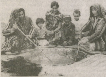
Ғузур туманининг «Гулшан» маҳалласида сумалак пиширилмоқда.