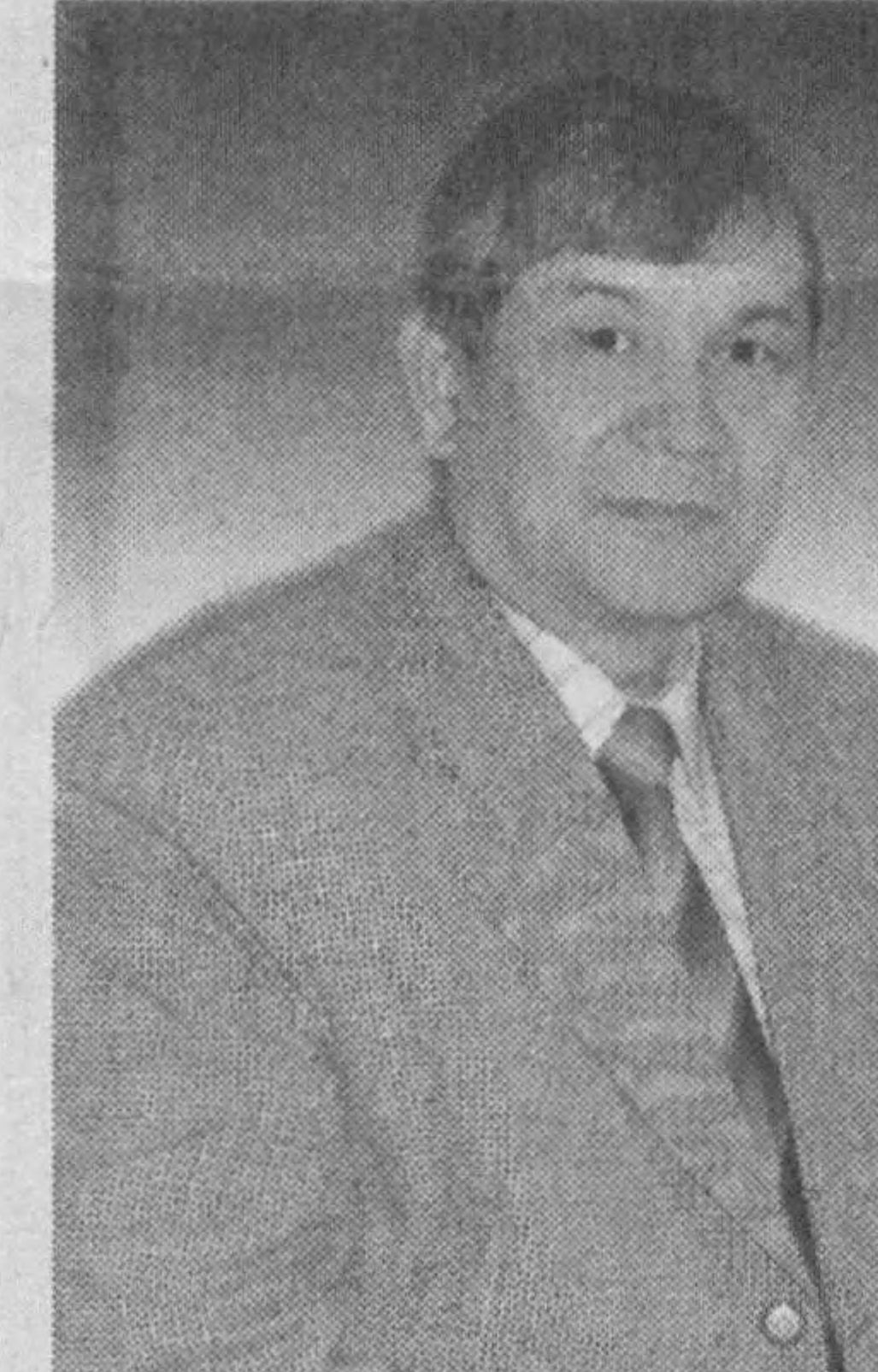
Мамлакатда икки палатали профессионал парламенти шаклланти-

риш ислохотлари халқимизни фуқаролик жамияти ва ҳуқуқий давлат қуришга доир стратегик мақсадларни амалга ошириш йўлидаги буюк яратувчилик сари интилишидир. Ўзбекистон Республикаси иккинчи қаҳир Олий Мажлисининг X сессияси (2002 йил, декабрь) «Ўзбекистон Республикаси Олий Мажлисининг Қонунчилик палатаси тўғрисида» ва «Ўзбекистон Республикаси Олий Мажлисининг Сенати тўғрисида»ги Конституциявий қонунларни қабул қилиб, мамлакатнинг янги, икки палатали парламенти шакллантиришини ва икки палатали парламент фаолиятининг асосий принциплари ва ҳуқуқий асосларини яратиб берди. Бунда Қонунчилик палатасининг кўппартиялик асосида шакллантирилиши ҳақида қандай асосий принциплар қаторида мустақамланди. Мамлакат парламенти тўғриси-