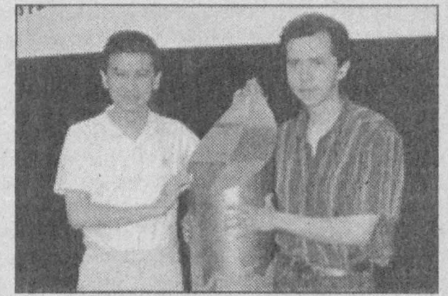
да олтин медални кўлга киритган. Ёш шохмотчининг эришаётган ютуқларини кўриб, Президентимиз

сини сурган. Шундан сўнг, 16 ёшга ча бўлган ўсмирлар ўртасидаги жаҳон чемпионидаги учинчи ўрин, 1994 йили Катар мамлакатининг Доха шаҳрида бўлиб ўтган Осиё чемпионати-