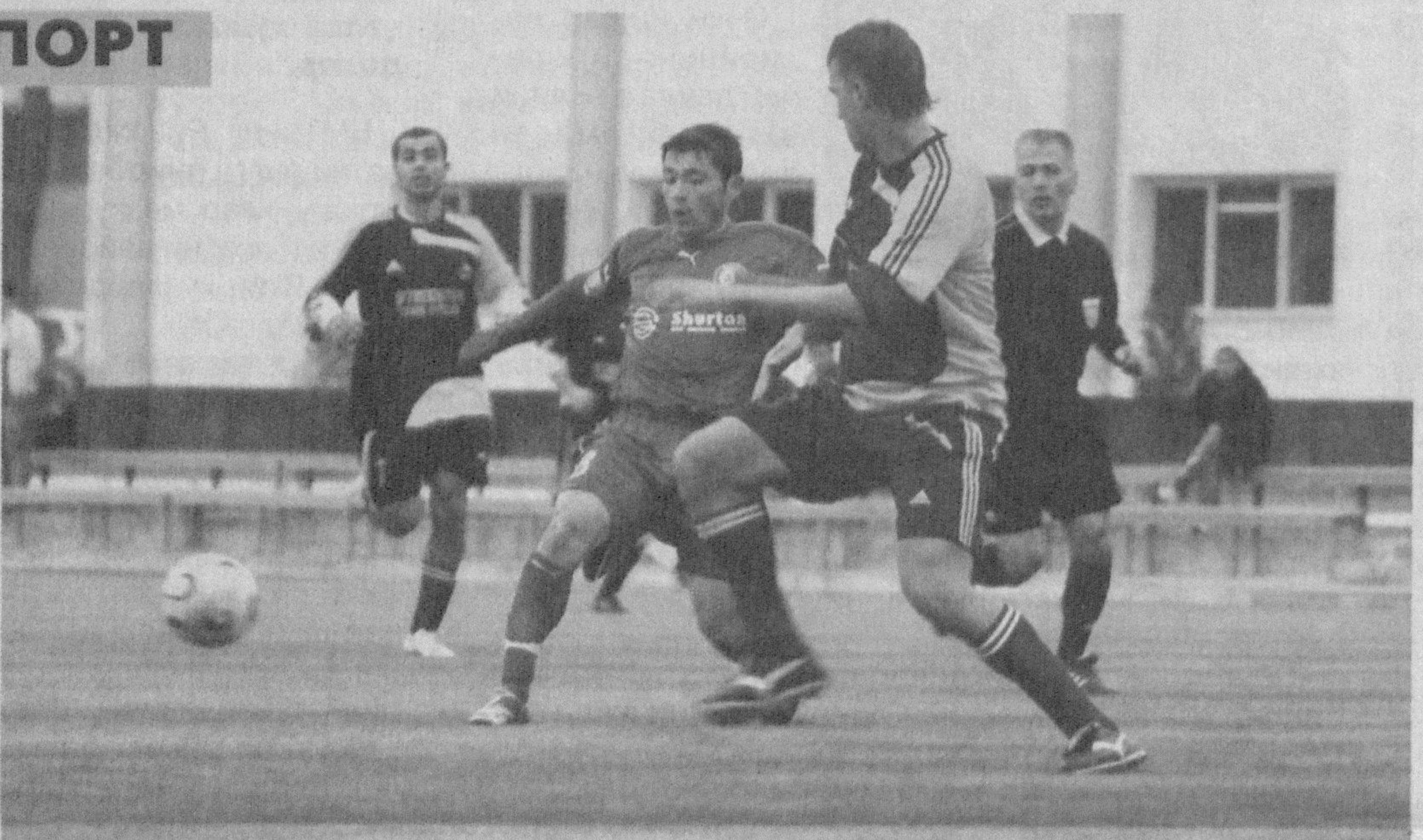
Футбол: мавсум тараддуди

Ўзбекистон футбол федерацияси қарорига мувофиқ, мамлакат XIX миллий чемпионати олий лигасида ўн тўртта жамоа медаллар учун кураш олиб боради. Куръага кўра, янги мавсум баҳслари 13 март куни бошланади.