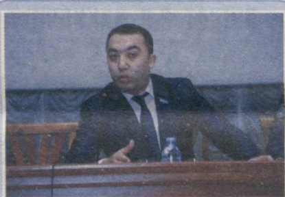
Олий Мажлис Қонунчилик палатаси депутати Дилмурод Исmoilов

— Меҳнат кодексининг янги таҳририда ходимнинг хавфсизлигини таъминлаш, шунингдек, ҳуқуқ ва манфаатларини ҳимоя қилишга қаратилган қоидалар ўз аксини топган. Халқимиз, айниқса, хотин-қизлар меҳнат жараёнида ўзларини эркин ва қулай ҳис қилишлари учун бир қатор янги қоидалар жорий этилмоқда. Масалан, мослашувчан иш вақти белгиланмоқда, яъни ходимларга иш кунининг бошланиши ва охирини мустақил равишда тартибга солишга руҳсат берилади.