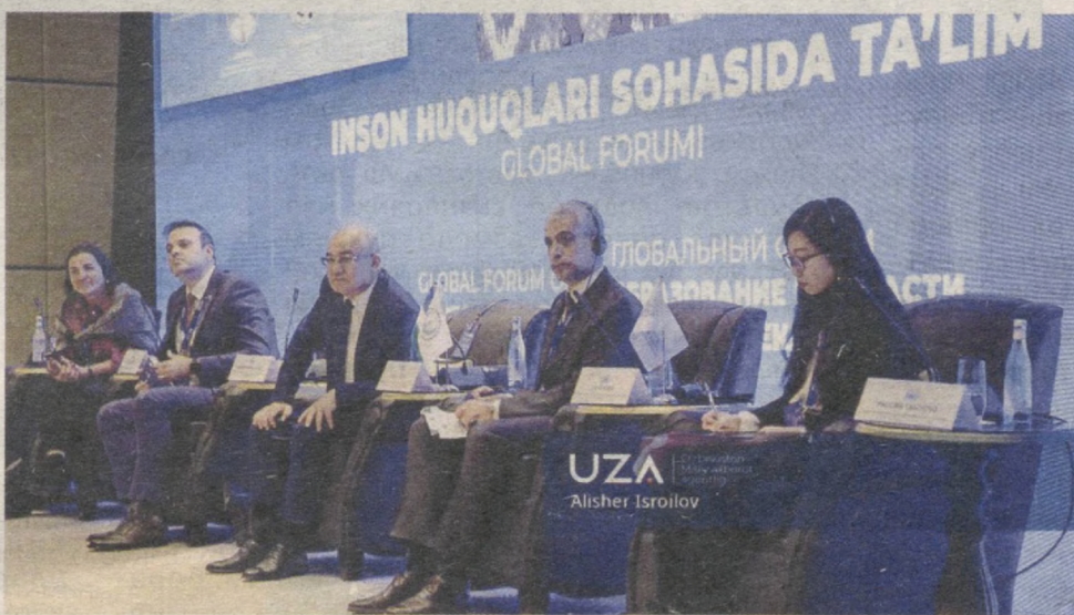
Самарқанд шаҳрида "Инсон ҳуқуқлари соҳасида таълим" Глобал форуми ўз ишини бошлади.

Бунда асосан инсон ҳуқуқлари бўйича самарали таълимга эришиш тамойиллари ва ёндашувлари муҳокама қилинди. Шунингдек, замонавий муаммоларни ҳисобга олган ҳолда, дунёнинг турли ҳудудларида инсон ҳуқуқлари бўйича таълим соҳасидаги технологияларнинг ривожланиши ва айна со-