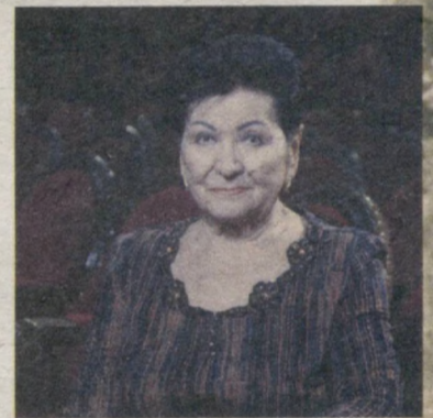
Дилбар Исмоилова, Ўзбекистон халқ артисти:

— Биз устоз билан ижодий сафарларга кўп чиқардик ва бундан фахрланардик. Турғун Хонтўраев билан Ғани аканинг ёши ўртасида адашмасам 10 йилча фарқ бор эди... Биз ёшлар бу икки устозимиз билан кўп ҳазил қилардик. Сафарларда Турғун акага ҳам, Ғани акага ҳам бир хил совға беришарди. Чопонлар, пичоқ, дўппи ва шунга ўхшаш эсдалик совғалари. Биз Ғани акага "иккиси ҳам бир хил экану, лекин Турғун аканинг совғаси материали сизникидан пича қимматроқ шекилли", десак дарҳол ҳазиллашиб совғаларни алмаштириб олардилар. Шунда Турғун ака "бунисини ҳам олинг", дея хафа бўларди. Баъзида "Аввал Ғани кийиб, кўриб олсин, қолганини мен оларман", деб жавоб берарди. Устозларимизни охиратлари обод бўлсин!