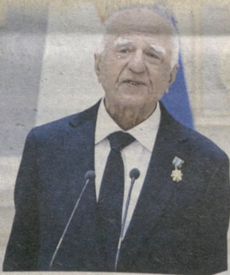
Иброҳим Гафуров, Ўзбекистон Қаҳрамони:

Ашула тугагандан сўнг барча бирваракайига “Воҳ!” деб юборди. Шундан кейингина қани йўлни оч, даврага чиқсин ҳофиз, деган талаблар туша бошлади... Шу тариқа Эркин акам билан жўшқин ижодга шўнгидик.