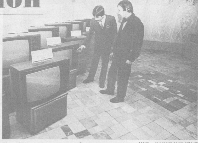
Как вас обслуживают?