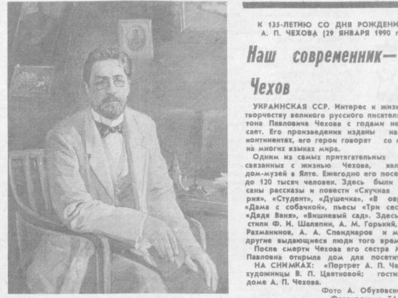
К 135-ЛЕТИЮ СО ДНЯ РОЖДЕНИЯ А. П. ЧЕХОВА (29 ЯНВАРЯ 1990 Г.)

Корр.: Сколько их и о чем они? В. Листьев: Таких материалов три. В первом рассказывается о селе, где родился один из