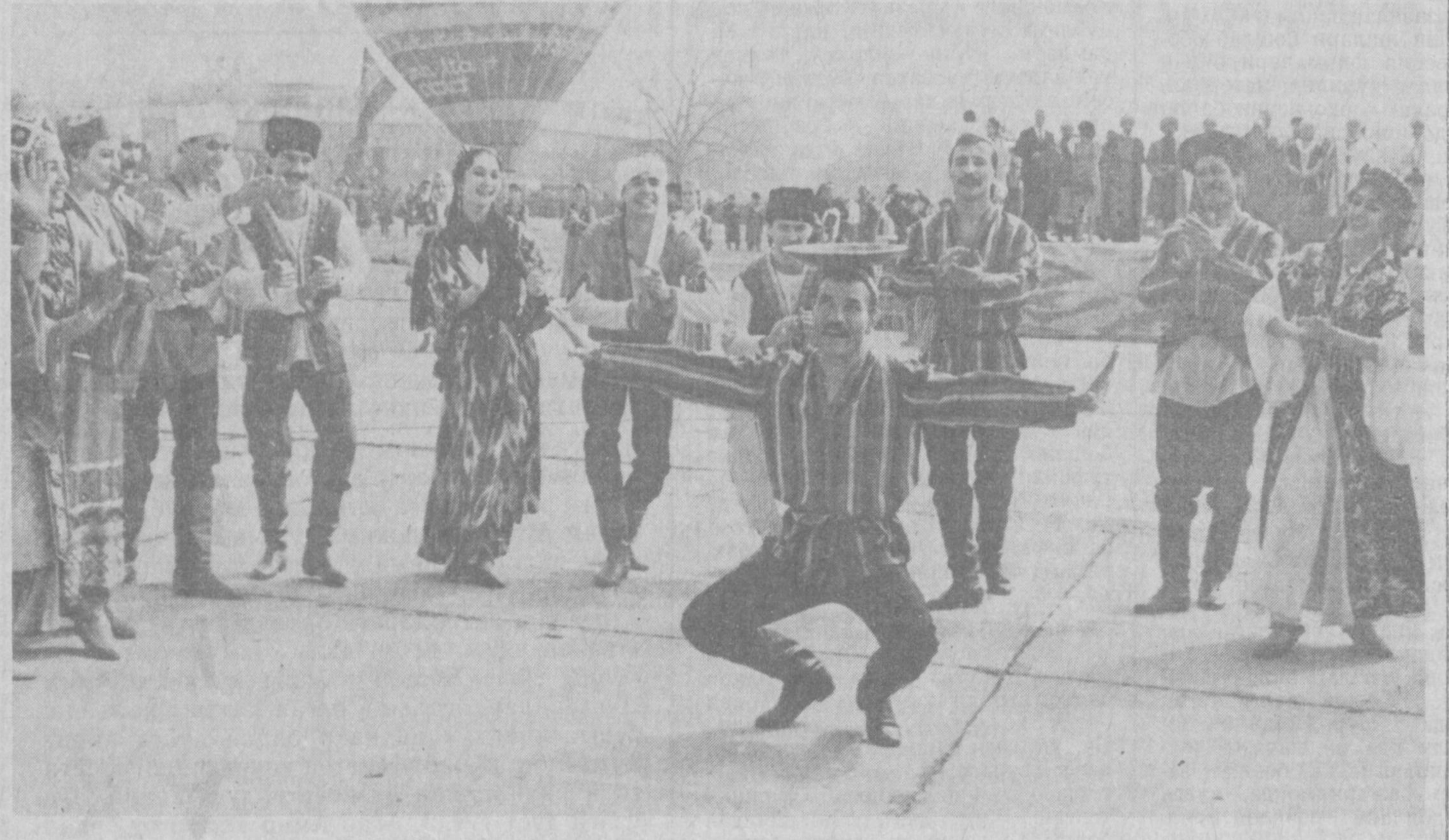
● МУСТАҚИЛЛИК НАШИДАСИ.