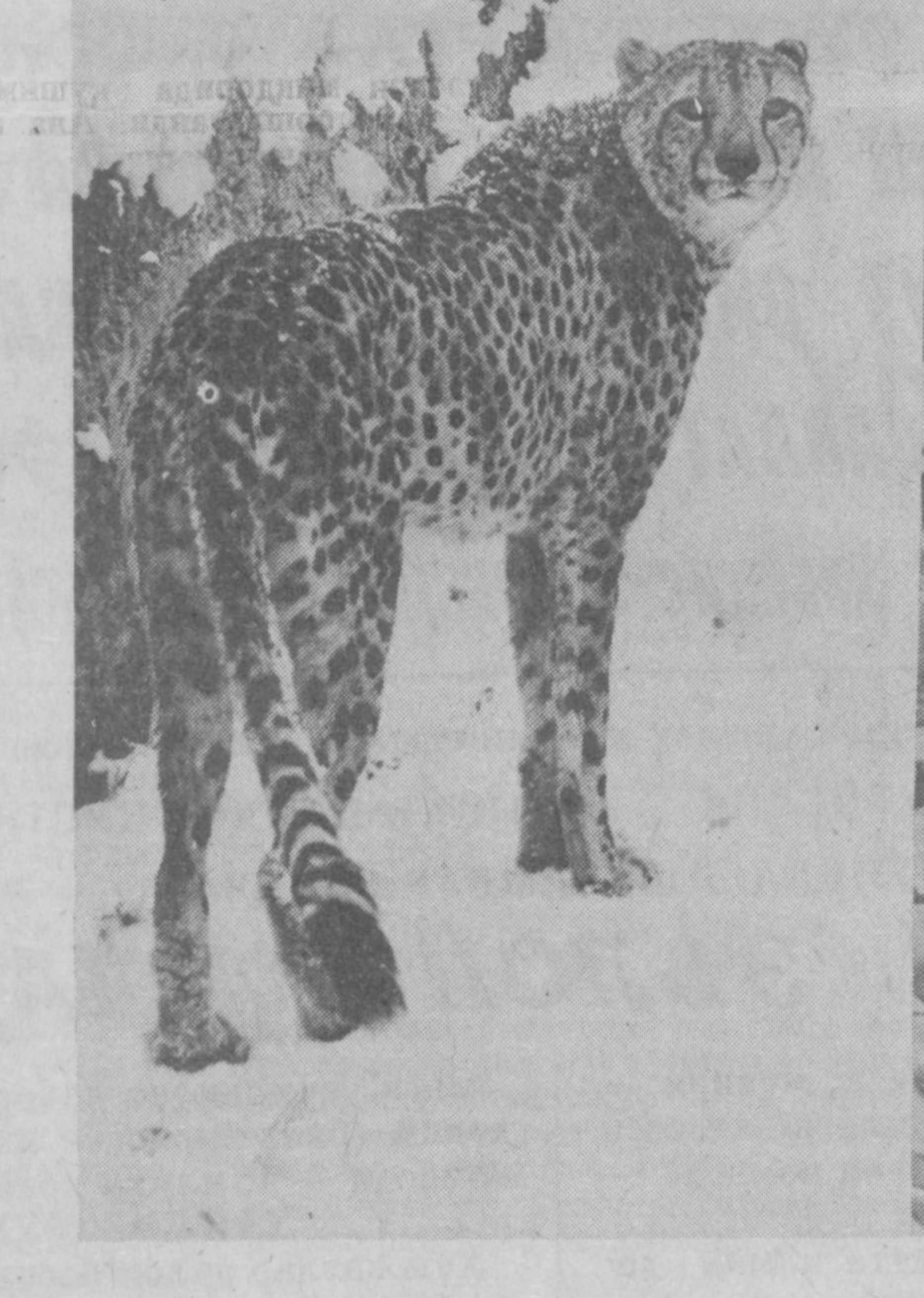
Кўзларинг бунча муғлил, қоплоним?..