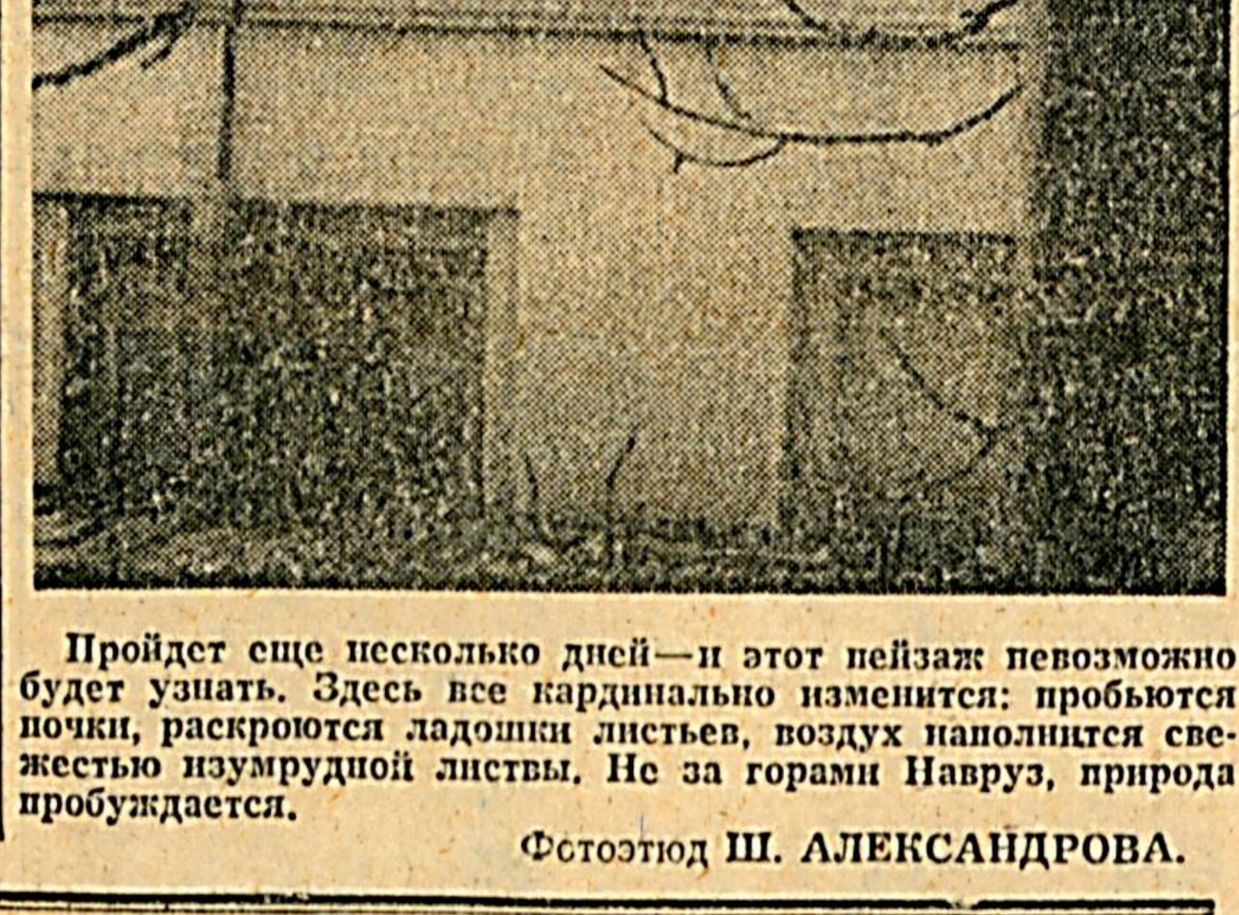
Пройдет еще несколько дней — и этот пейзаж невозможно будет узнать. Здесь все кардинально изменится; пробьются почки, раскроются ладошки листьев, воздух наполнится свежестью нозумрудной листвы.