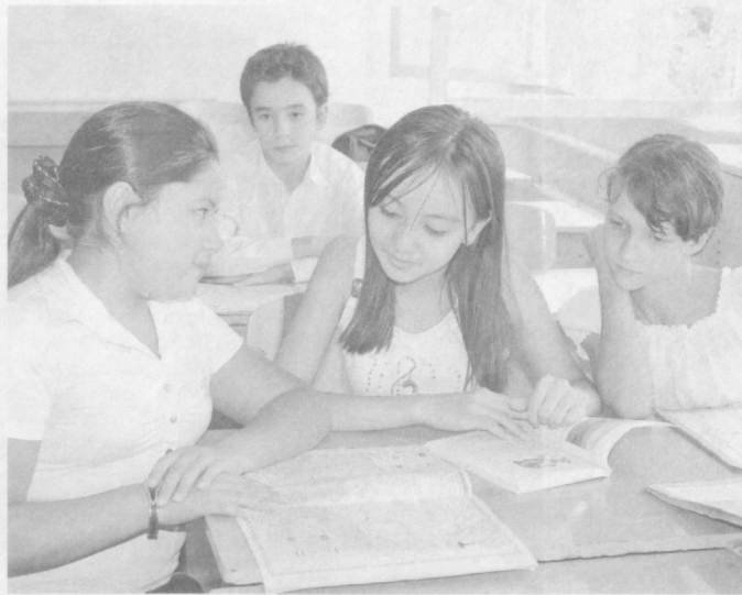
Каникулы прошли, впереди — новые знания.