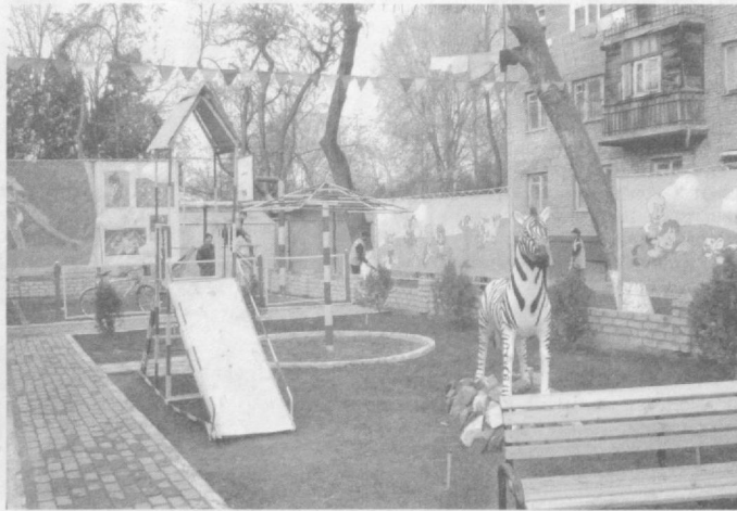
Этой цели способствует и организация разнообразных спортивных и народных игр на детских площадках махаллей.

Исследования ученых показывают, что 70 процентов информации, получаемой человеком на протяжении жизни, приходится на период в возрасте до 5 лет. Физический и интеллектуальный потенциал детей в основном развивается в ходе разнообразных игр. Созданные на детских площадках условия для занятий спортом и играми способствуют более тесному ознакомлению малышей с окружающим миром, их взаимному общению, помогают обрести уверенность в себе.