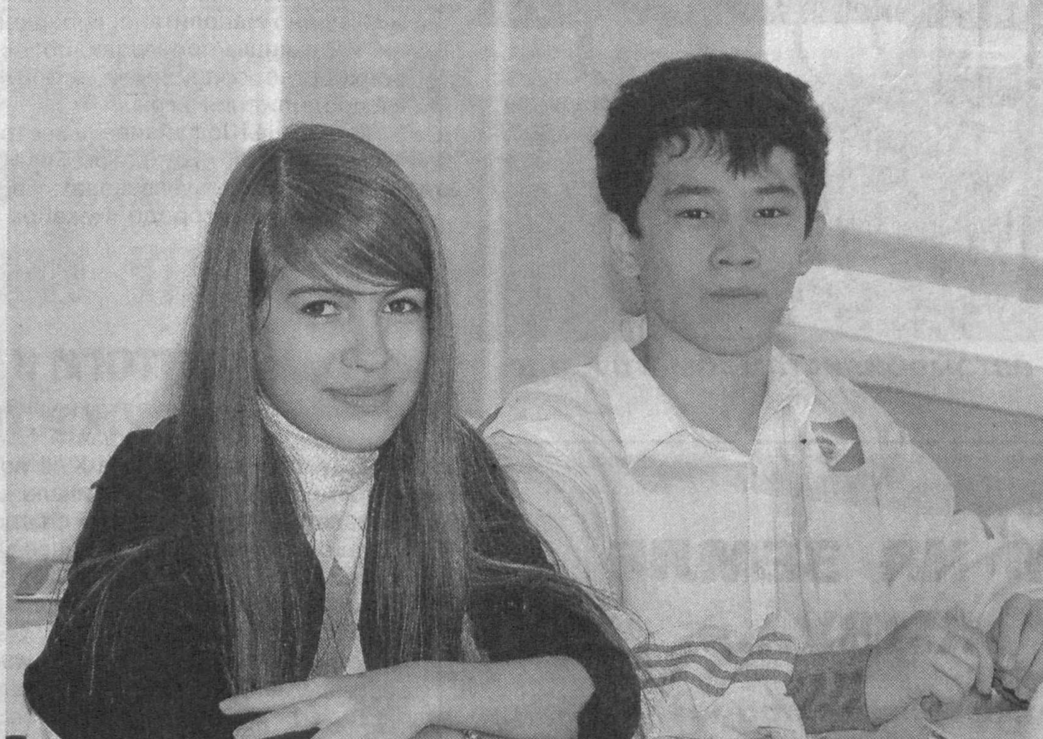
Учатся, чтобы больше знать и уметь.