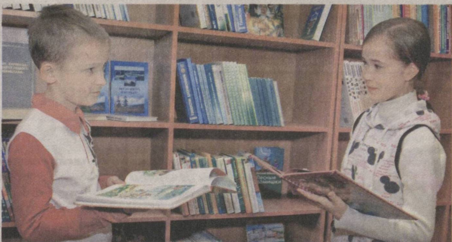
В мире творчества и знаний.

В Международном караван-сарая культуры Академии художеств Узбекистана состоялась интересная творческая встреча молодежи с ветеранами, военными журналистами, посвященная Дню защитников Родины и Году внимания и заботы о старшем поколении.