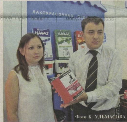
Отечественная лакокрасочная продукция пользуется большим спросом.