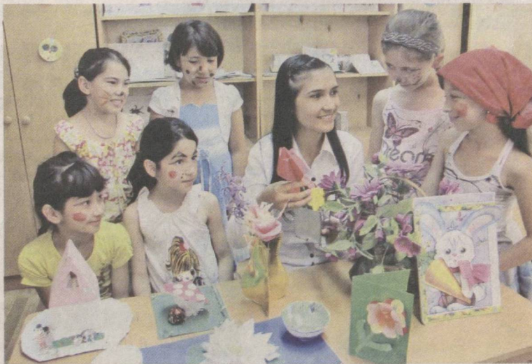
В дневном лагере «Калдиргоч» при школе № 254 Шайхантаурского района Ташкентское городское отделение Института здоровья и медстатистики провело мероприятие под девизом «Молодежь – против наркомании!». Были организованы спортивные состязания, викторины. Они помогли напомнить, каким страшным недугом является наркомания.

Победители награждены призами и дипломами от организаторов.