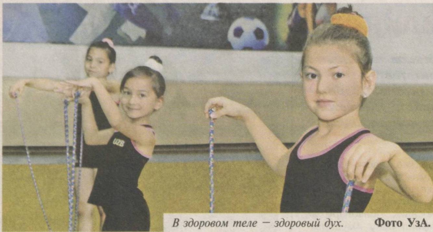
В здоровом теле — здоровый дух.