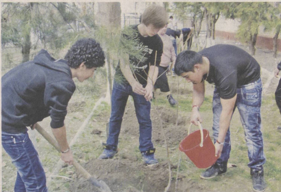
Каждый год в столице пополяется зеленый наряд.