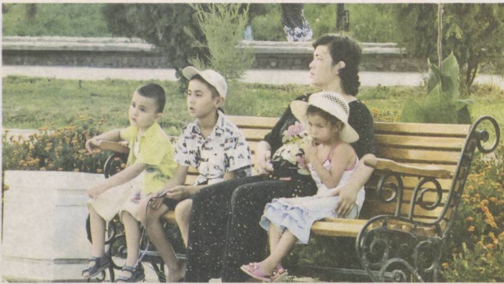
Ухоженные парки и скверы столицы — любимые места для семейных прогулок.