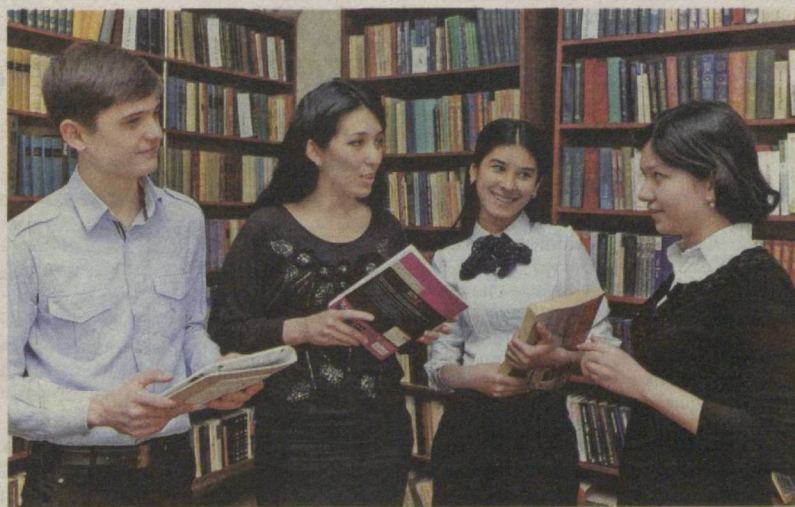
В информационно-ресурсных центрах столицы молодежь всегда может найти полезную и нужную информацию.