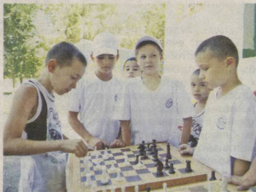
Занятие шахматами развивает умственные способности.