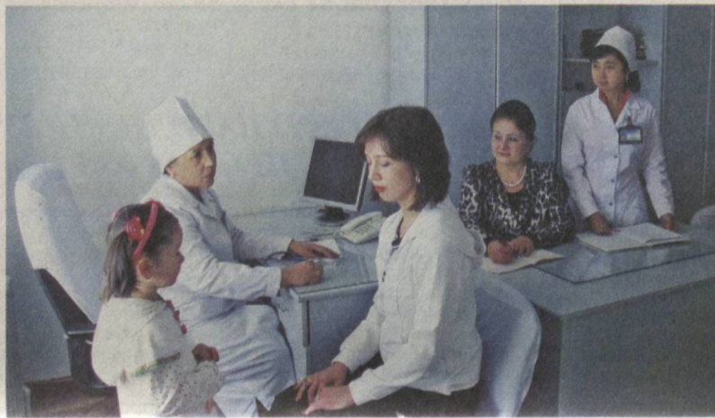
Забота о здоровье детей и их матерей — один из приоритетов государства.