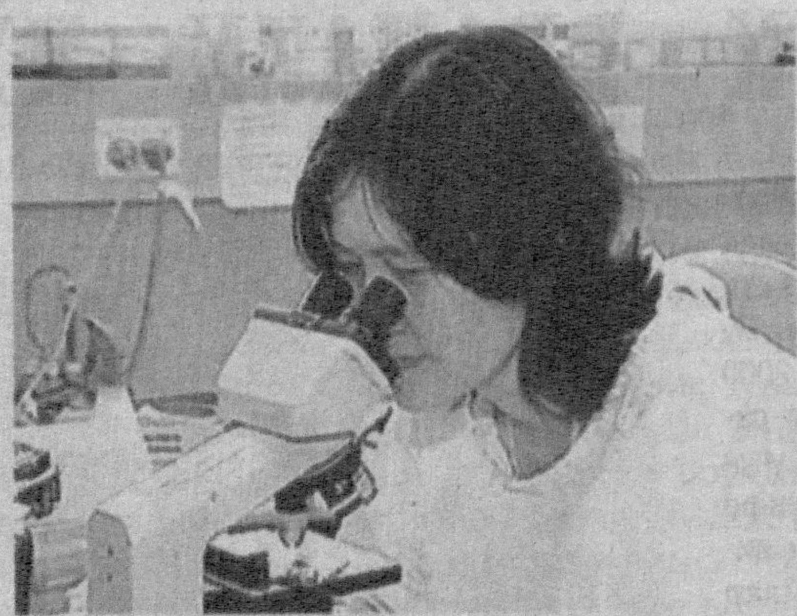
захоти бемор ётиши керак. Унга биринчи навбатда тинчлик даркор. Дам олиши, иссиқ сўт ичиши, иссиқ ишқорий қараганда, ер юзиде руй бераётган иқлимий ўзгаришлар, атраф муҳит ва экологиянинг ифлосланиши, сунъий толарлардан

Грипп кўзгатувчи микроблар — ортомикровируслар оиласига киради. Одатда хасталикка чалинганда тана ҳарорати 38-40° С гача кўтарилади. Холсизлик, бош айланиши, оғриши (айниқса, пешонада), кўлоқ шангиллаши юз бериб, томоқ, халқум, нафас йўли қирилиб оғрий бошлайди. Бир неча соатдан сўнг бурун ва кўздан ёш оқиб, қуруқ йўтал бошланади.