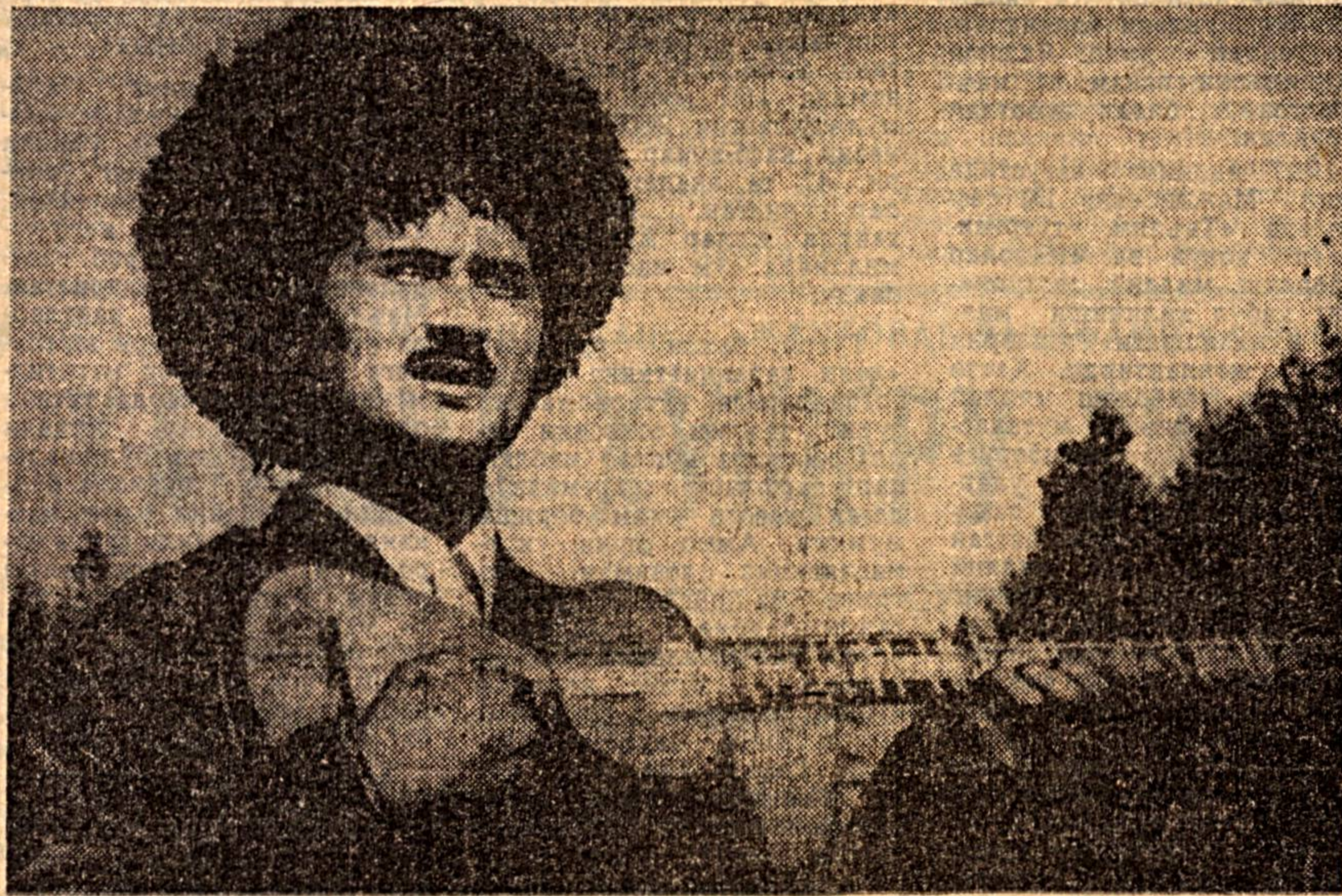
Гап беллашуларда кўлга кийрилган гўлбонда эмас. Мундофту раббатларда ҳам эмас. Ёнг мўҳими, Қаландар бахши асрларда асрларга ўзгариб кетган халқ озаки ижоди дурдоналарини сақлаб қолди...