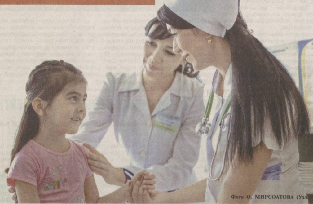
Охрана здоровья детей – непреложная задача государства.

2016 год – Год здоровой матери и ребенка