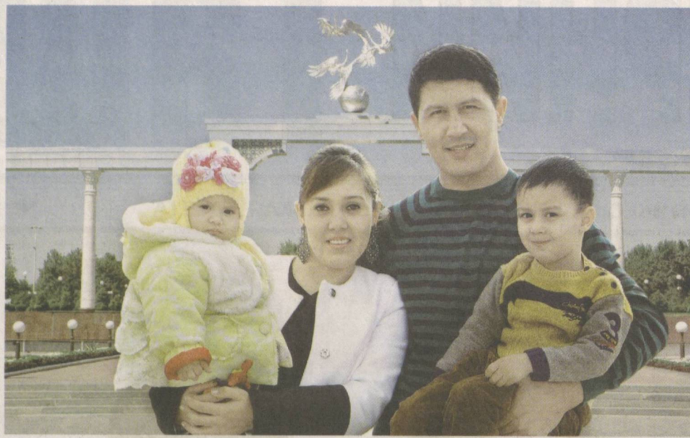
Счастливая семья – оплот благополучия страны.