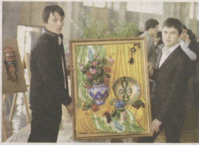
Творим красоту своими руками.