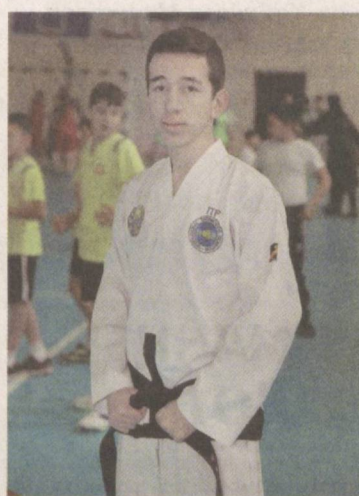
В стране подрастает новая спортивная смена.