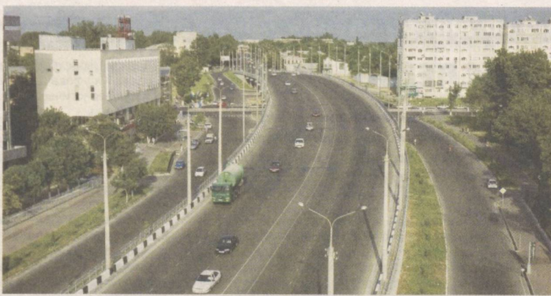
Очарование любимой столицы.