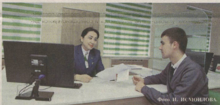
«Не клиент для банка, а банк для клиента» – главный принцип финансовых учреждений страны.

Сообщается, в частности, что в новом докладе Всемирного банка и Международной финансовой корпорации «Ведение бизнеса-2016: оценка качества и эффективности регулирования» Узбекистан по индикатору «Получение кредитов» поднялся со 105-го места на 42-е.