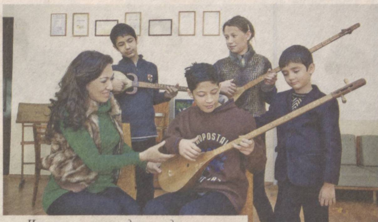
Национальные мелодии всегда покоряют слушателей.

В детской школе музыки и искусства № 1 Юнусабадского района города Ташкента учатся свыше 300 мальчиков и девочек. Одно из самых образцовых в столице подобных учебных заведений имеет прочную материально-техническую и учебную базу.