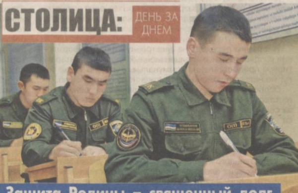
Защита Родины — священный долг

Мы высоко оцениваем то, что в Узбекистане поддерживается развитие гражданского общества, которое всесторонне участвует в реализации программ в сферах здравоохранения, защиты окружающей среды, социальной поддержки уязвимых слоев населения, а также в законотворчестве.