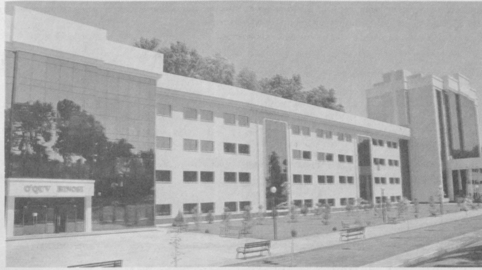
Во все времена года красив наш город.