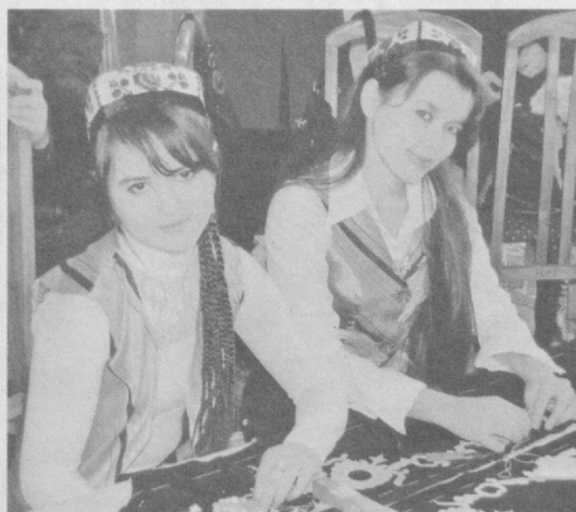
С занятий в кружках, центрах «Баркамол авлод» рождается интерес к творчеству.