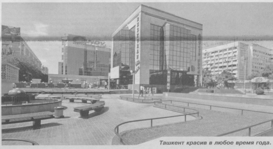
Ташкент красив в любое время года.