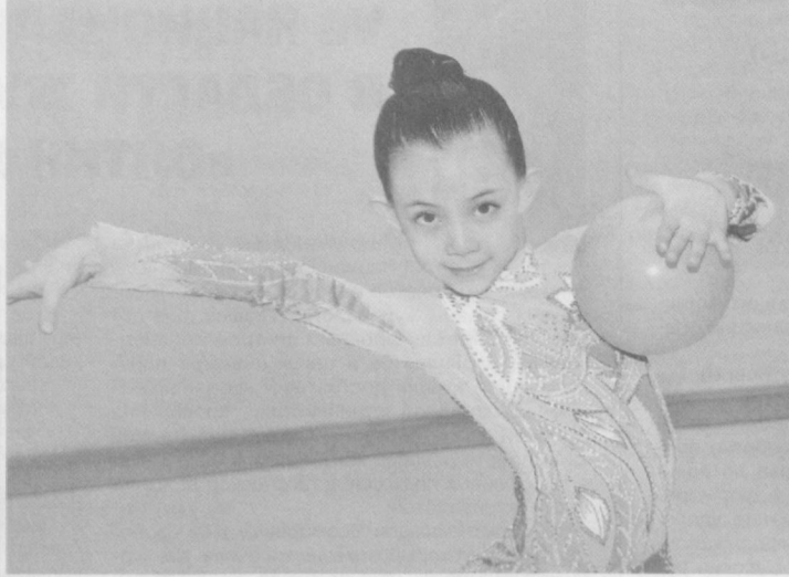
Надежда женского спорта.