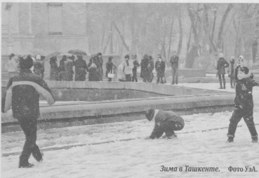
Зима в Ташкенте.