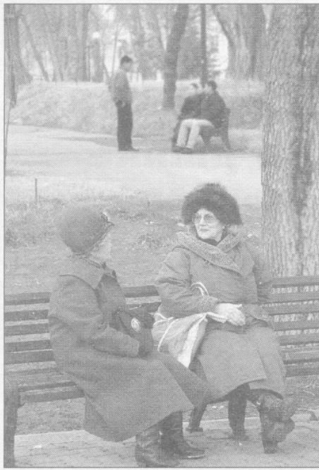
Хорошо в январский день погреться на солнышке.