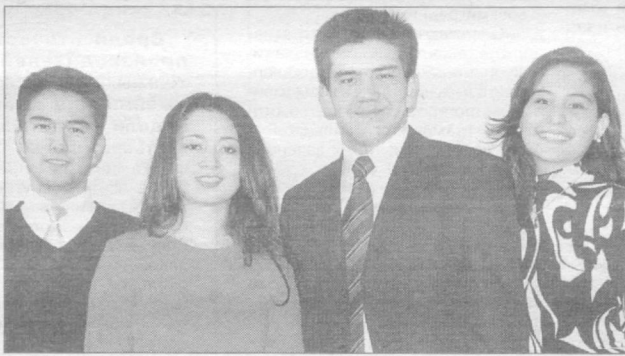
Молодость — прекрасная пора.