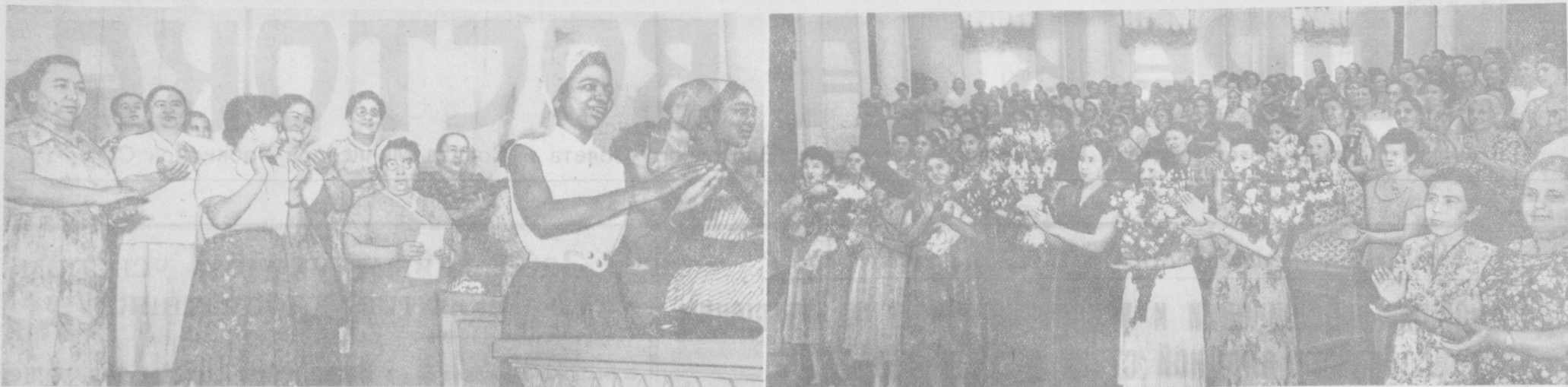
На снимках: на встрече женщины Ташкента с группой делегатов IV конгресса Международной демократической федерации женщин.