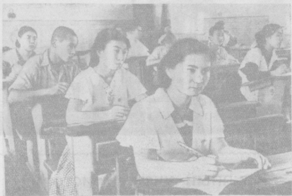
Вчера в школах республики начались выпускные экзамены в десятых классах. На снимке: ученики школы № 20 Кировского района Ташкента на экзамене.

Главный бухгалтер транспортной конторы стройтреста № 150.