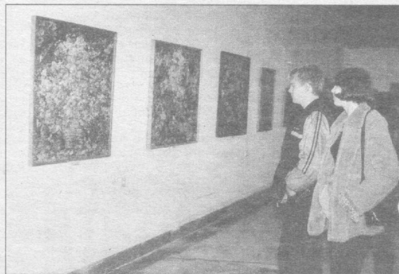
раз показала, что прекрасная половина человечества не только красива и обаятельна, но и безгранично талантлива.

Словом, проходящая сейчас выставка «Гимн женщине» еще