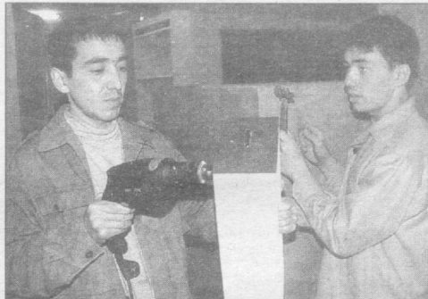
Хорошим спросом пользуются изделия, изготовленные мастерами «Тонг мебель».

ды, а также одинокие и малоимущие. □ В целях повышения уровня информированности населения о путях заражения и методах профилактики туберкулеза Общество Красного Полумесяца Республики Узбекистан объявило конкурс на лучшее освещение этой проблемы в средствах массовой информации. □ Во Дворце культуры «ТТЗ» прошел вечер отдыха, в концертной программе которого приняли участие коллективы художественной самодельности татарской диаспоры. Инициаторами его проведения выступили активисты Татарского общественного культурно-просветительского центра. □ Вчера в школе № 18 Армянский культурный центр провел праздничное мероприятие для женщин армянской диаспоры, посвященное Международному женскому дню.