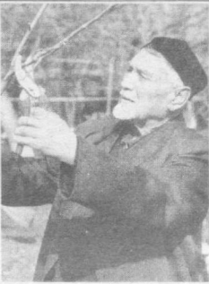
И вновь весна на белом свете!