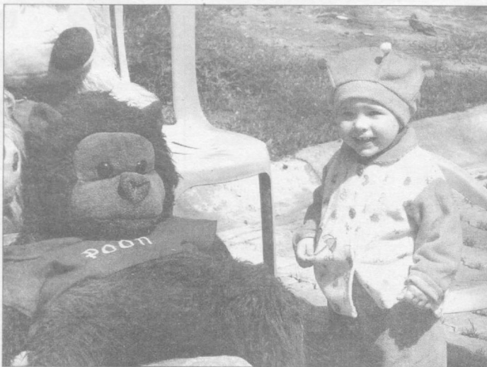
А я тебя не боюсь...