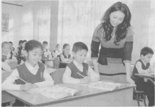
Школа открывает детям огромный мир знаний.