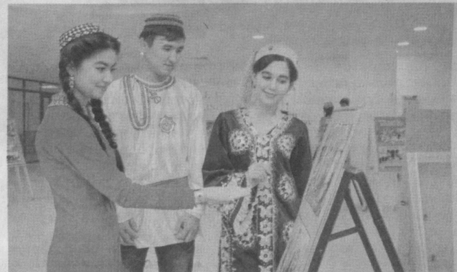
Наша страна стала родным домом для людей разных национальностей и народностей.

При национально-культурных центрах работают кружки по изучению родного языка, воскресные школы, в которых не только дети и молодежь, но и взрослые изучают родной язык, приобщаются к национальной