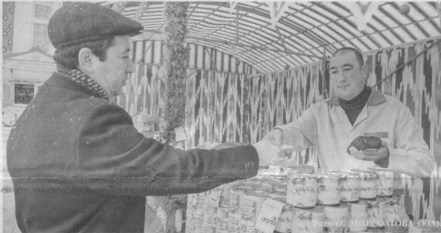
Наши рынки славятся своим изобилием.