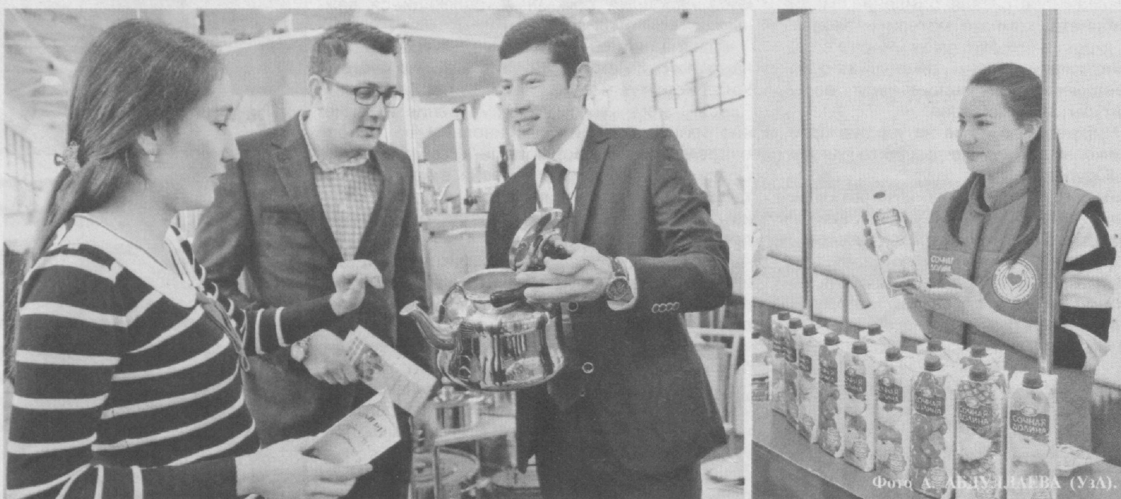
Промышленные выставки демонстрируют высокий потенциал отечественных производителей.