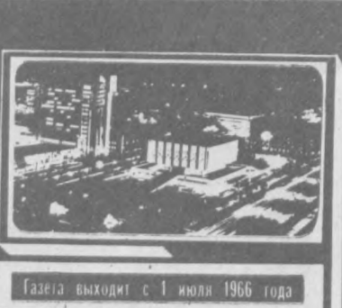
Газета выходит с 1 июля 1966 года