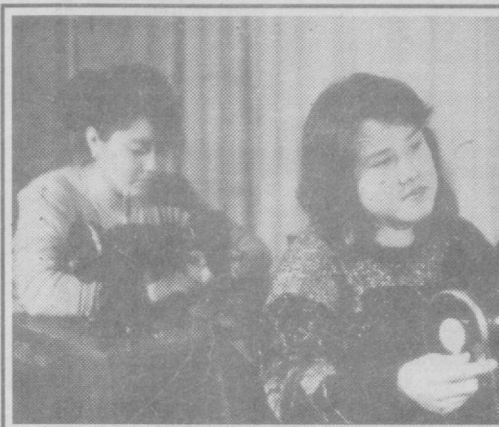
Мир ваших увлечений