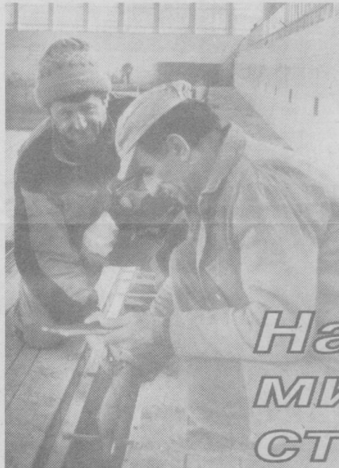
Именно такую цель преследует реконструкция Дворца водного спорта — главной водной базы, на которой готовятся к спортивным рекордам спортсмены-пловцы.