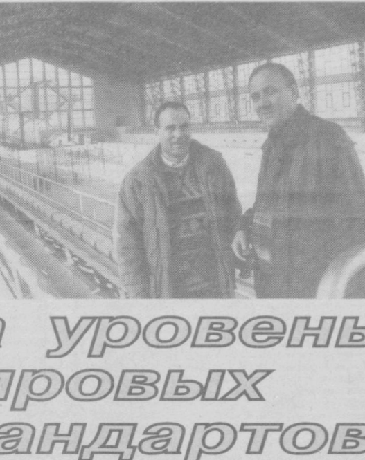
Именно такую цель преследует реконструкция Дворца водного спорта — главной водной базы, на которой готовятся к спортивным рекордам спортсмены-пловцы.