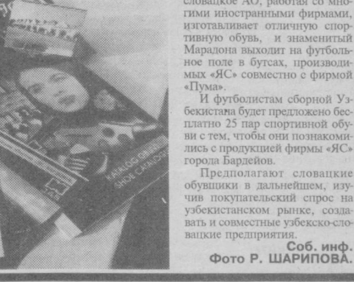
Соб. инф.