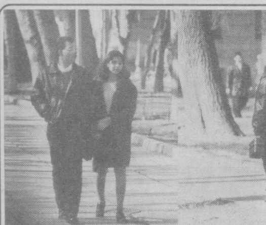
Как много девушек хороших!..

Но чего это мы так расчувствовались? Мы ведь еще не