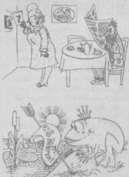
Рис. М. Самойлова.

бит устранить всевозможные праздники. Коллектив салона — не исключение. Частыми становятся программы красоты, в программу которых входит проведение костюмированных показов моделей причесок. Также устраиваются и конкурсы парикмахерского искусства для гостей отеля «Ле-Меридиан». Обычно эти праздничные шоу бывают приурочены к знаменательным событиям, празднованию Нового года, Дня независимости Республики Узбекистан, Науруза.