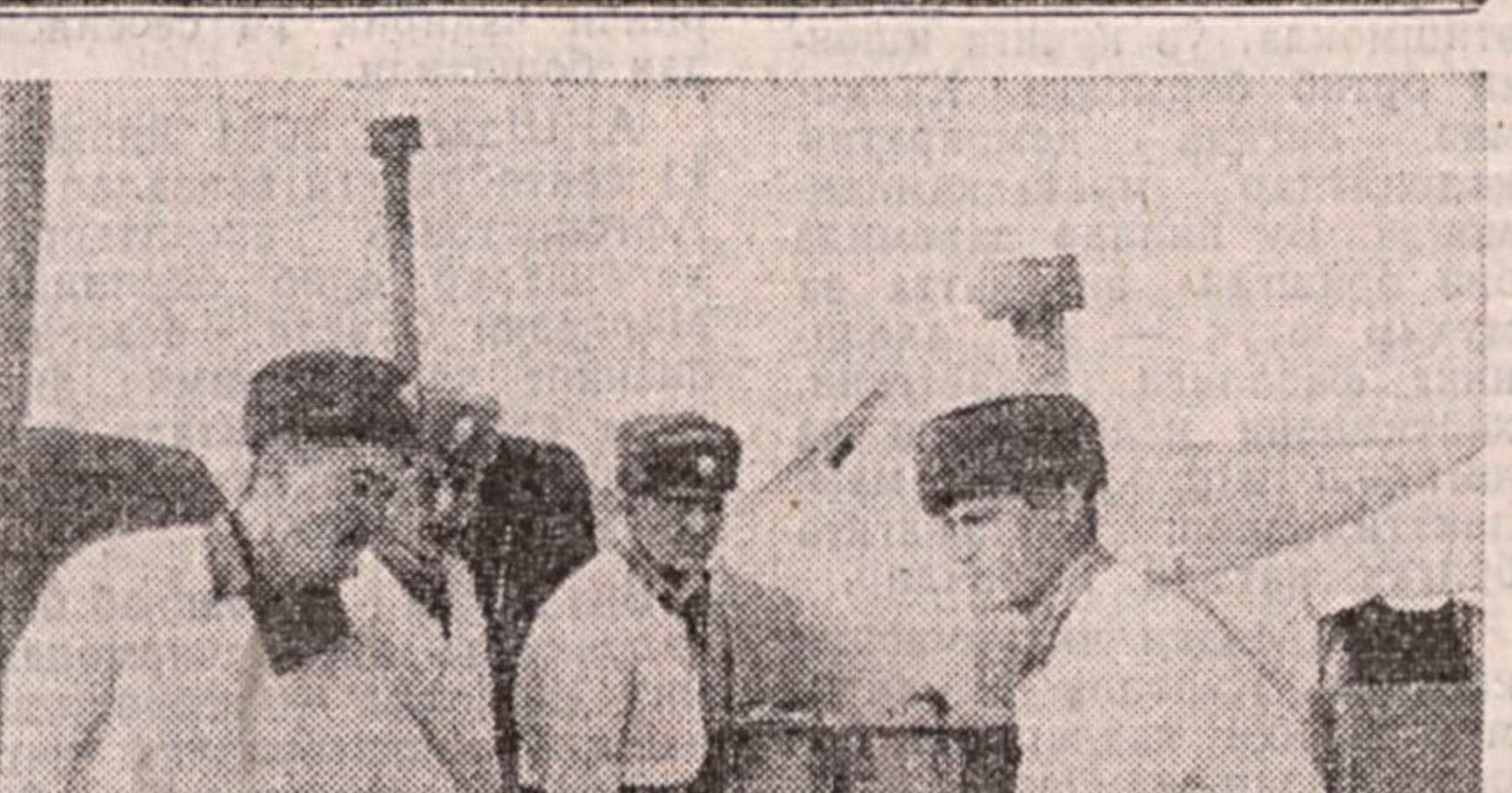
Ошпазлар ҳар қандай ҳолатда посбонларга сифатли овқатлар тайёрлаб, етказиб беришга шай турмоқлари лойим.

Теурийлар тарихи давлат музейида шеърят султони Алишер Навоий таваллудининг 561 йиллигига бағишланган илмий анкуман бўлиб ўтди. Унда таниқли навоийшунос — олимлар, шарқшунослар, тарихчилар, филологлар, олий ўқув юртлири ўқитувчилари ва ёшлар иштирок этди.