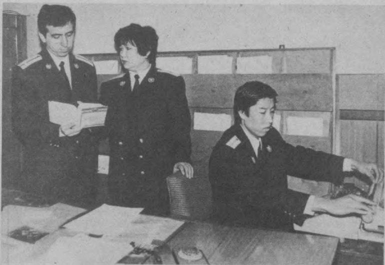
В транспортной прокуратуре г. Ташкента