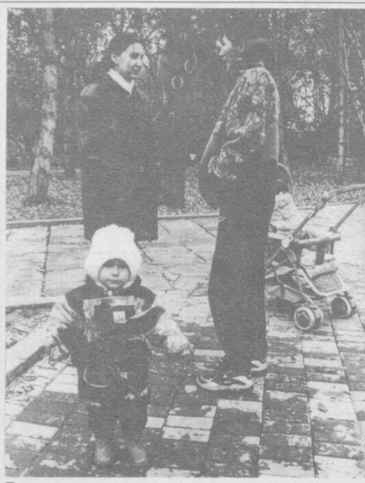
Папа, мама, я...