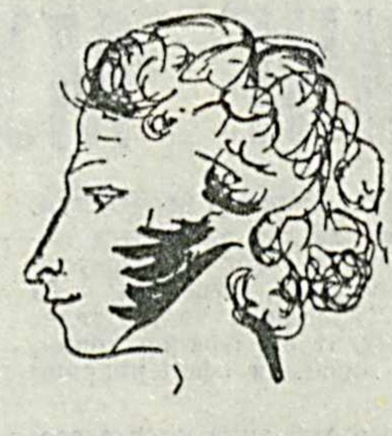
А. С. Пушкин. Автопортрет. Ушакволар альбомиданги расм. 1829.

Бу ҳайкал жуда кўпчилигимизга боғлиқ бўлган учун жуда кўпчилигимиз улар ҳайкални кўриб, ўзлари секин-секин эртанги муаллифини танийди. Чимента борадиган йўлда, тоғда ўсган Пушкинга ўхшаб турган арчаи кўрган барча кекса-ю ёш афсона тинг-