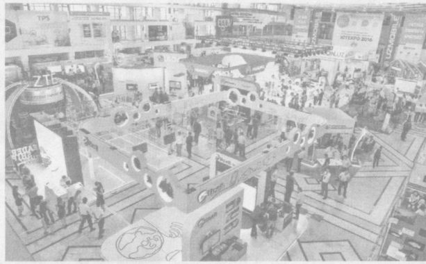
Экономические выставки — витрина достижений страны.

Следует особо отметить, что в процессе подготовки к выставке от зарубежных компаний поступают выгодные предло-