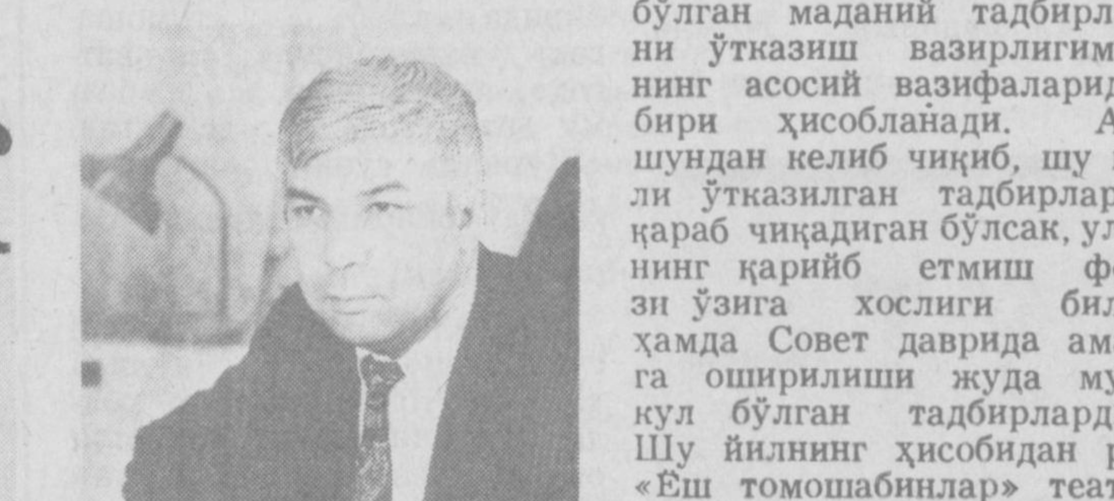
ЎЗБЕКИСТОН РЕСПУБЛИКАСИ МАДАНИЯТ ИШЛАРИ ВАЗИРИНИНГ ҲАҚИДА ҲАҚИДА ҲАҚИДА ҲАҚИДА

мурилар сулоласини олайлик, Амир Темур, Улуғбек, Бобур, Хўмоошхоқ, Акбаршоҳ, Шоҳ Жаҳон ва сулоласининг бошқа давомчилари томонидан қуририлган иншоотлар ҳозирги кунда ҳам Темурийлар даври меъморчилик санъатининг ўзинга хослиги билан кўпчилигини ҳайратга солиб келмоқда. Айниқса, Шоҳ Жаҳон томонидан сукули ҳозирнинг Мумтоз вафотидан сўнг, унга атаб қурдирган Тож Маҳал мақбараси жаҳоннинг етти мўъжизалари билан бири саналади. Савдолингиздан келиб чиқиб яна шунинг айтқимизки, буюқ ақдодларимизнинг ишларини давом эттиришимиз учун энг зарур ҳисобланган мустиқилликни, миллат эрини тағини ва сиёсий ҳурликни қўлга киритдик. Ўзбекистон иқтимоий, иқтисодий ва сиёсий соҳада иқобий ўзгаришлар сари дадил қадимлар қўймоқда. Биз вазирилик тасарруфиданги маҳасаса, ташкилотларда хизмат қилаётган етқ қурувчи уста-лар, меъморлар ёрдамида буюқ ақдодларимиз мақбараларини, сағаналарини ва даҳмаларини таъмирлаш ишларини олиб бормоқдамиз.